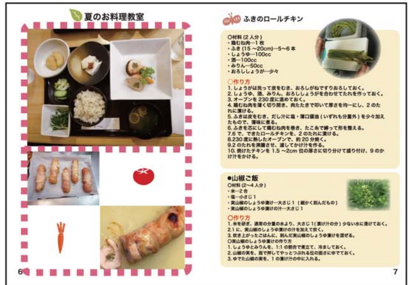
内容見本 ※画像は2013年のものです